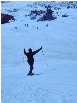
NM君はシール登高を楽しんでいます