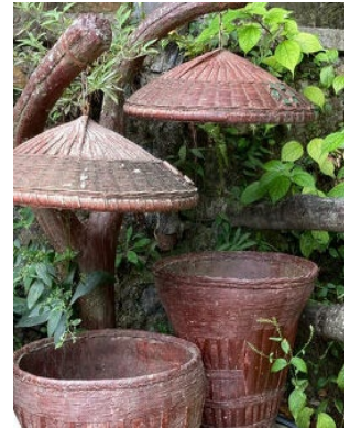
武陵源で見かけたゴミ箱

中国は空前の旅行ブームだという。この度まわった雲南省と湖南省の観光地は、何処も肩が触れ合うほどの混み様だった。でも、至る所にゴミが散乱…は前の話であった。どこにも箒と塵取りを持った複数人の清掃人の姿があり、ゴミ箱が設置されており、警告の立札が建っていた。彼ら、彼女らの努力があって観光地の美化が保たれている感じがした。例えば、タバコのポイ捨てを何度か目にした。靴で火をもみ消してお終いである。同じことがレストランや食堂でも同じである。食事を終えたテーブルを見ると、客が中国人か外国人だったかが直ぐにわかる。