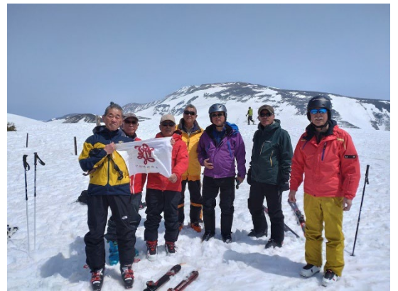
姥が岳山頂で集合写真撮影です 背景は月山山頂です