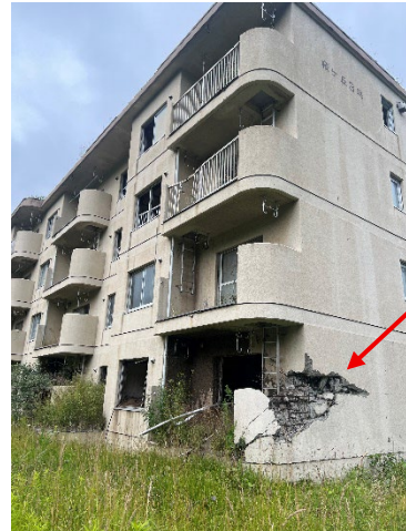
市営住宅跡地(1 階は地下)

□12 日：昭和新山 398m（1943~45 年噴火）交流登山と三松正夫記念館見学