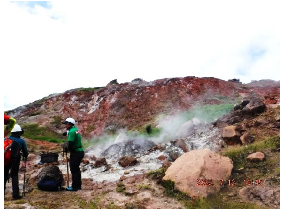
蒸し焼き料理の場所