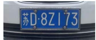
(画像はパソコンからのコピー)

電気自動車（EV）普及率を見ると2018～2020年の3年間は5%、2021年には15%、22年は29%、23年は38%、24年は48%と急激に普及し初めている。勿論、その裏には政府による税の優遇や補助金などの強引な手だてが後押ししている。そして、2030年までには新車販売のガソリン車は全てハイブリット車（HV）とし、ガソリン車は市場から排除されるという。国主導による強硬策を可能にしているのが他でもない国の政治体制である。