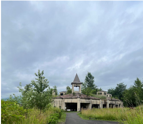
町民温泉施設跡地

講演終了後、噴火による災害遺構場所として《町民温泉施設や市営住宅及び流された橋等》を見学し、自然災害のすさまじさを改めて認識しました。