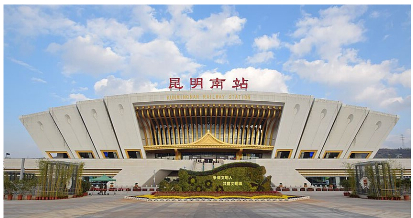
駅舎は大きく立派 (画像はパソコンからのコピー)

発車15～20分前に改札が始まると同時に長蛇の列ができた。中国人用ゲートは全自動チェックでスムーズに流れる。中国人スタッフのいる外国人用の改札口に進み、パスポートを提示し、本人確認を済ませてからプラットフォームに向かう。さらに、目的駅に着いたら外国人専用ゲートでパスポートチェックを受ける。外国人の動きが一部始終監視されている感じで、世界有数の監視社会を実感する。