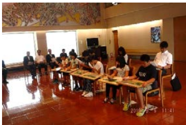
⑫解説を聞く小学生