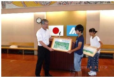
⑥明安小学校へ贈呈