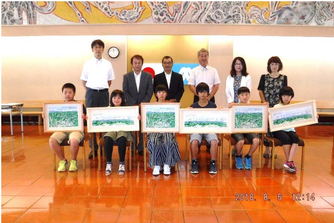
⑮贈呈式の記念写真