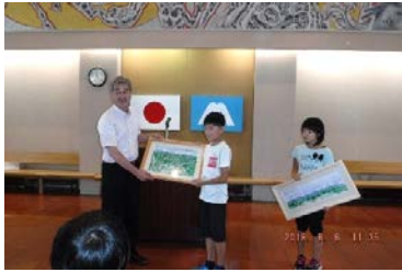
⑦有屋小学校へ贈呈