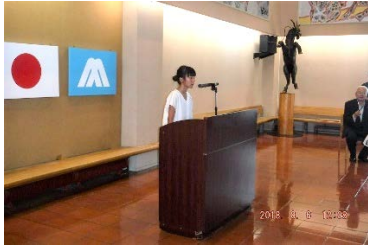
⑭小学生代表者からの謝辞