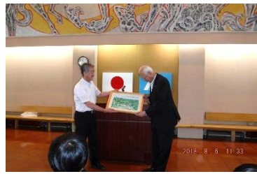
④町長へ贈呈(鳥瞰図)