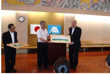
④町長へ贈呈(展望図)