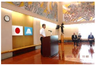
⑩野堀支部長の解説