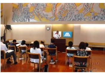
⑪野堀支部長の解説