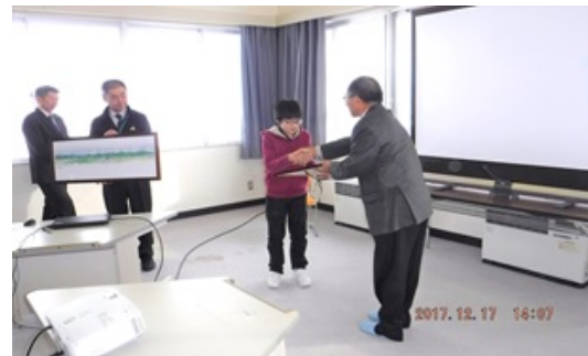
6年生代表への鳥瞰図の贈呈