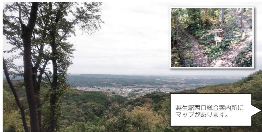
越生東方面を望む

新たに西山三石に展望台ができましたので周辺に展望台やオーパークなどを案内するコース案内板を12本設置しました。