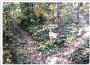
越生駅西口総合案内所にマップがあります。