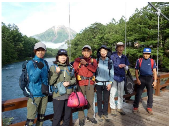
河童橋にて・焼岳遠望

終日、降雨が激しいとの予報で「徳本峠」山行は中止とし、明神「山のひだや」を目指したスイーツ散策に変更(好評でした)。山研で解散。