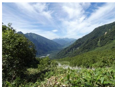
乗鞍岳・霞沢岳遠望