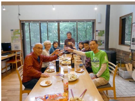
山研で豪華(笑)な夕食