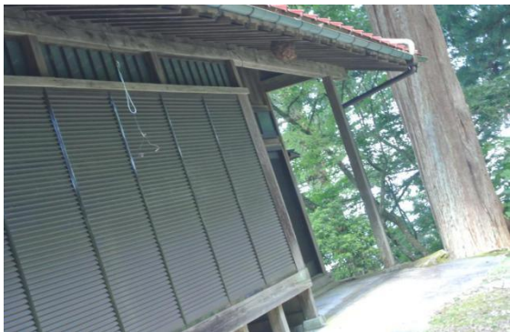
薬師堂跡にスズメバチの巣を発見(13:14)