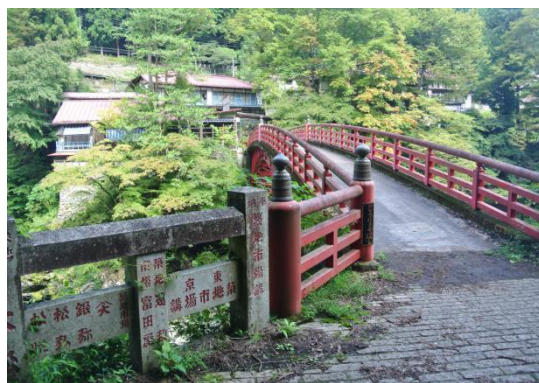
登龍橋より大輪を望む