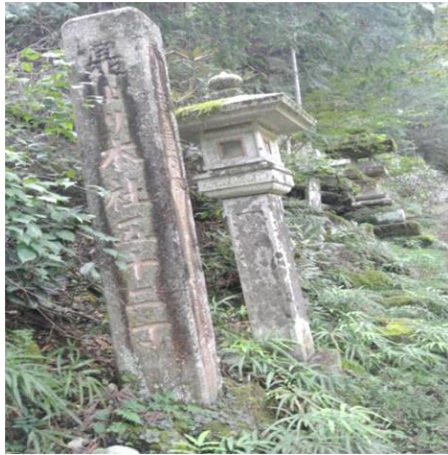
是より本社五十二丁 石柱(10:47)