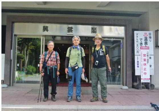
9月29日興雲閣前にて(8:54)