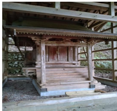
立ち入り禁止内建造物(大陽寺敷地)(13:47)