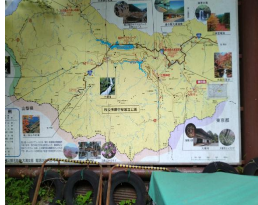
奥秩父案内図(大血川沿い) (14:47)