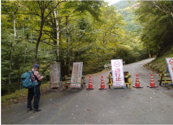
太陽寺敷地内立ち入り禁止 看板(14:34)