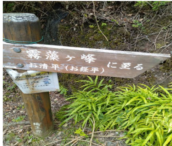
道標(お清平)(13:02)ここから大陽寺敷地内(立ち入り禁止)