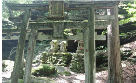
清浄宮門(奥にお宮) (11:50)