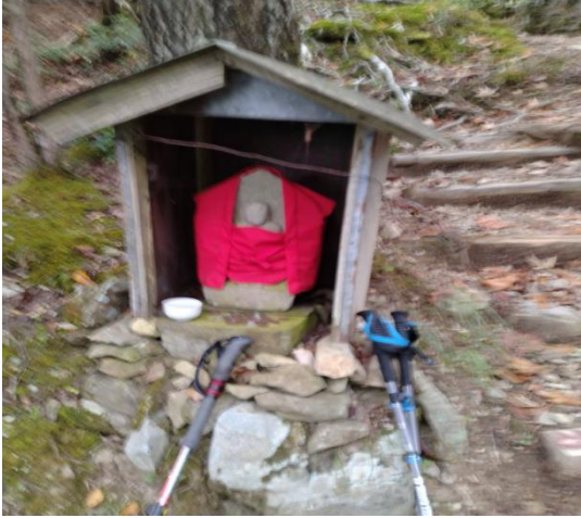
地藏峠のお地藏様(12:01)