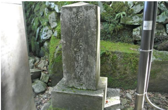
最後の第五十二丁名石(13:35)