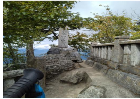
奥宮脇秩父宮殿下御登山記念