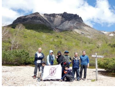
茶臼岳をバックに(姥ヶ平)