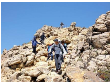
朝日岳から下る鎖場