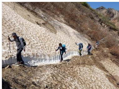
剣が峰近くの雪渓