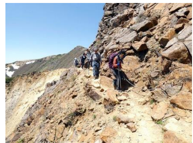
朝日岳から下る岩場