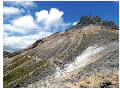
牛ヶ首からの茶臼岳