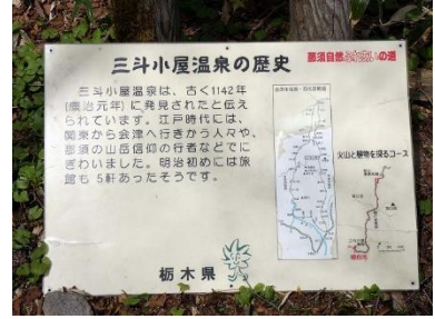
三斗小屋温泉の歴史